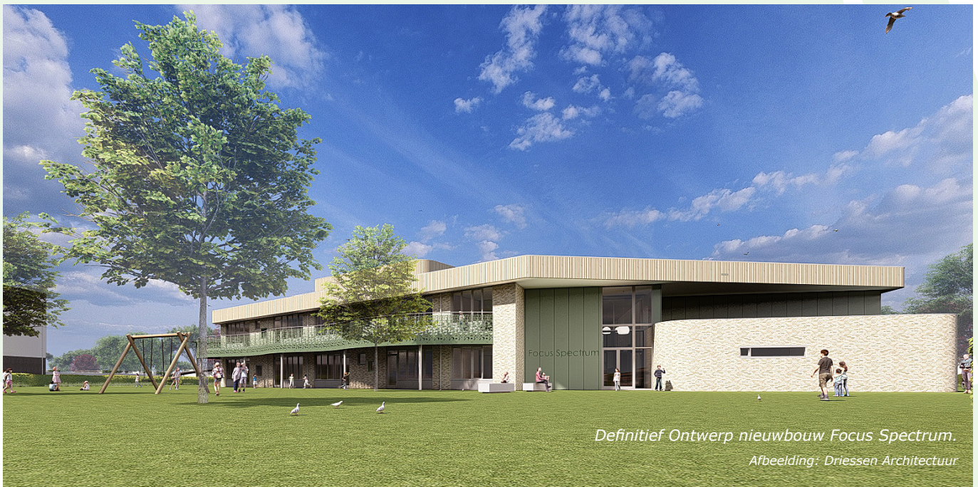
Definitief Ontwerp nieuwbouw Focus Spectrum.

Omdat we tijdens de sloop overlast door trillingen verwachtten, heeft de aannemer trillingsmeters gebruikt. Hiermee konden we in de gaten houden of er niet te veel of te harde trillingen waren. Dit is gelukkig niet het geval geweest. Ook hebben we voorafgaand aan de sloop een onafhankelijk expertisebureau ingeschakeld om de aanliggende woningen aan de St. Antoniusstraat en St. Franciscuslaan te inspecteren. Vanaf begin november zullen de eigenaren van deze panden weer een brief krijgen voor een nieuwe inspectie.