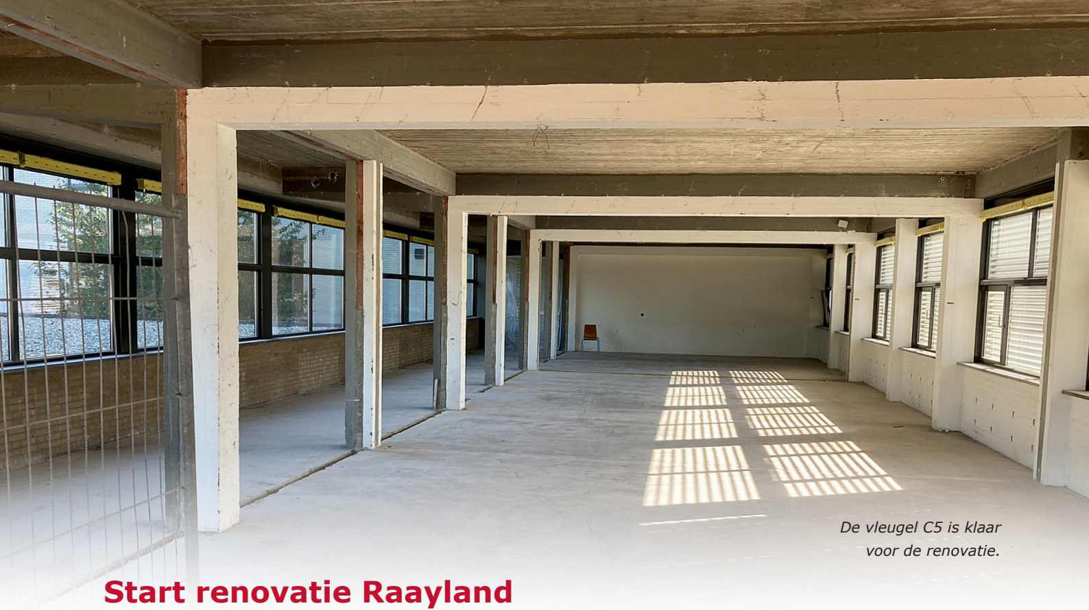
De vleugel C5 is klaar voor de renovatie.